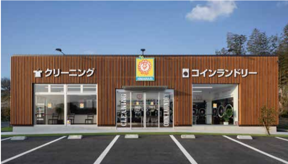
▲クリーニング工場・店舗・コインランドリーの融合を実現した「ランドリーステーション」。 地元にも少しでも貢献できるように AED・防犯ベル・消火器・こども 110 番などを設置している

当店は熊本県北・山鹿市を中心に6店舗で営業しております。地元密着でお客様の顔が見える店舗です。お客様が笑顔で袖を通される姿を思い浮かべながら一点一点大切に扱わせて頂いております。